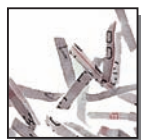
Coupe croisée 2 x 15 mm Niveau de sécurité DIN 4 Documents confidentiels ou secrets.