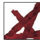
Coupe croisée 4 x 60 mm Niveau de sécurité DIN 3 Documents confidentiels.